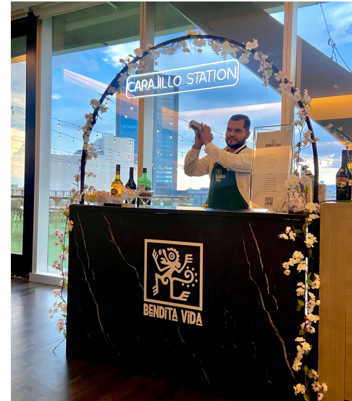
Incluida + 60 ps Marmol negro