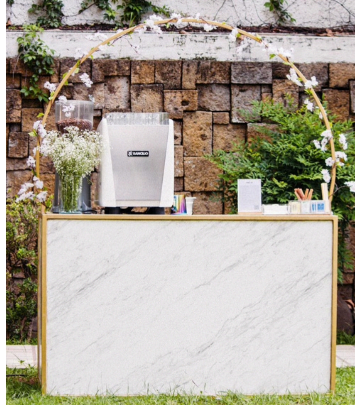
Incluida +60 Ps Marmol blanco