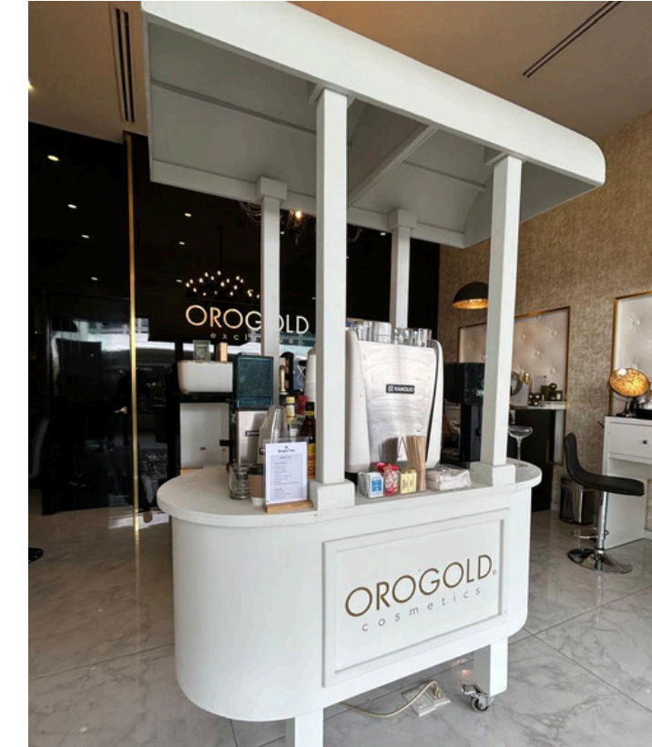
Incluida +150 ps Costo $1,500 Carrito blanco