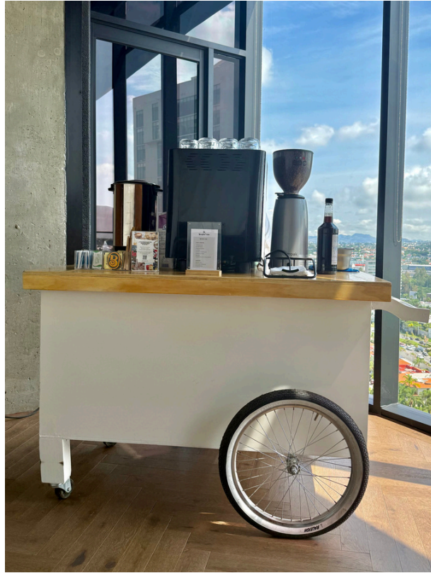
Incluida -50 Ps Blanca plegable