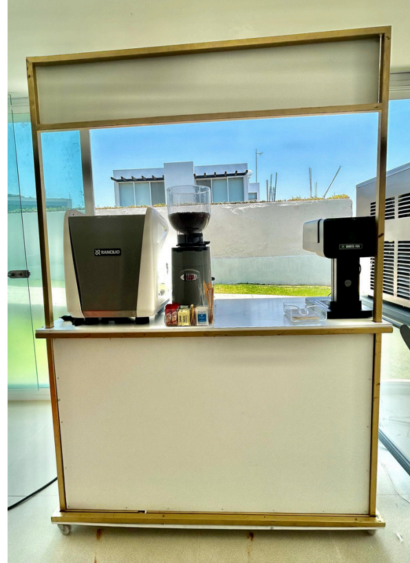
Incluida -50 Ps Blanca plegable